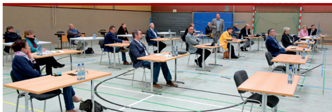
Die Teilnehmenden des Bildungsgipfels, coronabedingt in der BBS

Ende 2019 wurde die Verwaltung beauftragt, einen Bildungs- und Betreuungsgipfel einzuberufen, mit dem Ziel „ein Gesamtkonzept für die Bedarfsdeckung für Krippen- und Kindergartenplätze und ein zukunftssicheres, vielfältiges Angebot an weiterführenden Schulen (inklusive Förderschule „Geistige Entwicklung“) zu erarbeiten.“